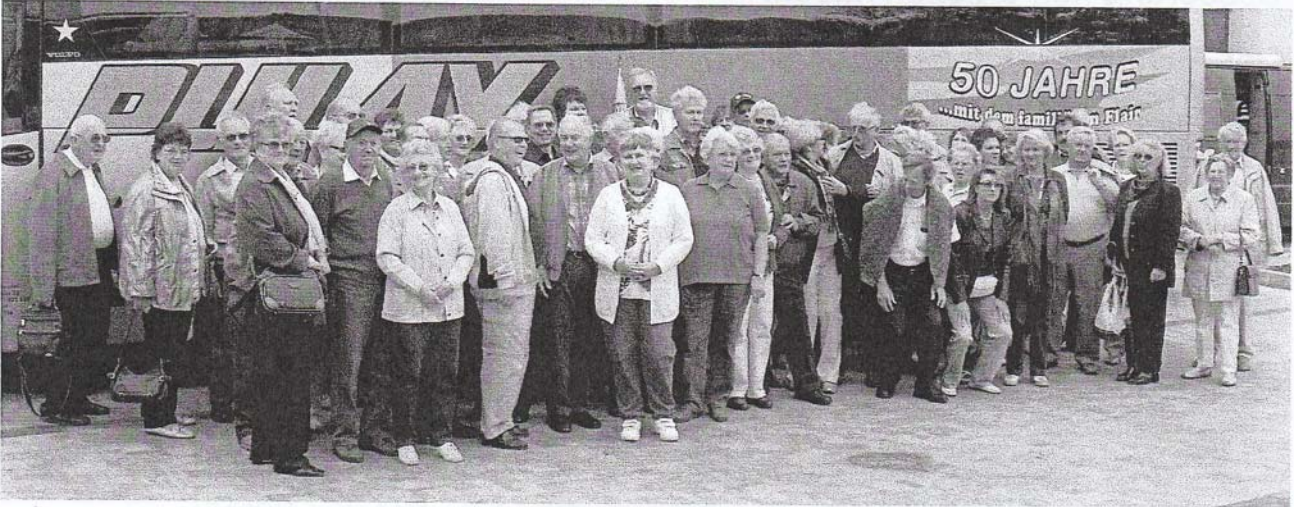
Die zufriedenen Reisetilnehmer

Nach einem guten Mittagessen in Dobersberg ging es, weiter nach Telc.