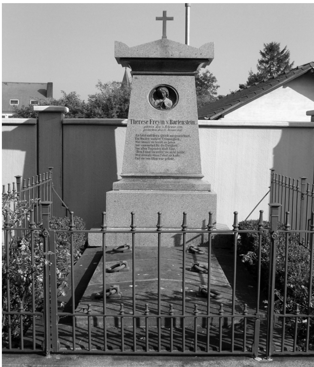
Das Grab von Therese von Bartenstein im Friedhof in Tribuswinkel