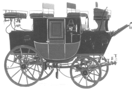
In England gebaute Postkutsche

Beeindruckend die Liebe, die in dieser Arbeit steckt. Technisch interessant die technische Entwicklung der Kutschen – von ungefedert bis 4 fachgedert. Weiters sahen wir eine italienische Kutsche mit gebogenen Scheiben.