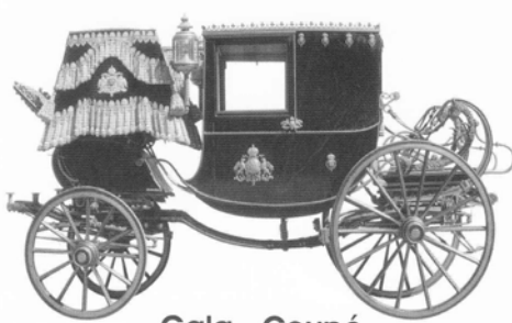
Gala - Coupé

Nach der Besichtigung ging die Fahrt weiter nach Retz, wo ein ausgezeichnetes Mittagessen im Gasthof Brand am Programm stand. Als Nachspeise (wurde dem Obmann entwendet) „geklaute Apfelkuchen“ – der ausgezeichnet geschmeckt hat und das Lob aller gefunden hat.