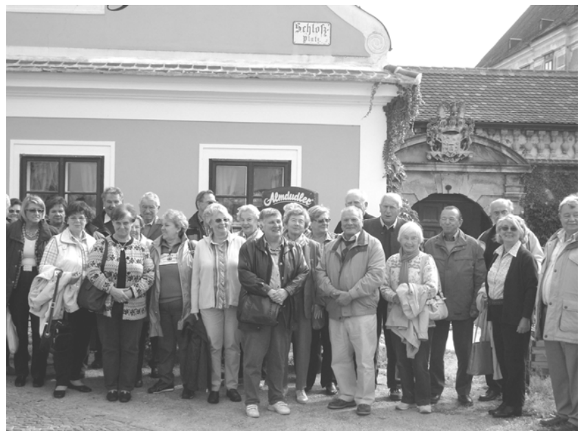
Die zufriedenen Teilnehmer

Noch eine kleine Randnotiz - ein neugeworbenes Mitglied bedankte sich persönlich für den schönen Ausflug.